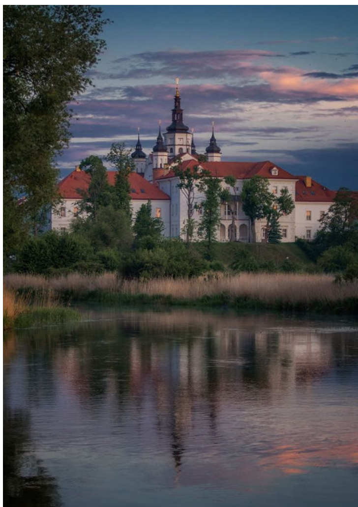
Fot. Misty paths / Ścieżki we mgle